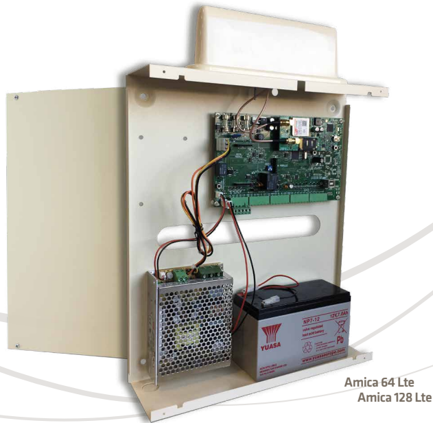
Amica 64 Lte Amica 128 Lte

Le fotografie dei prodotti hanno scopo illustrativo, le loro proporzioni non sono correlate (batterie non incluse).