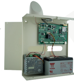
Elisa 24 LTE