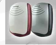
Mini Sirya WT